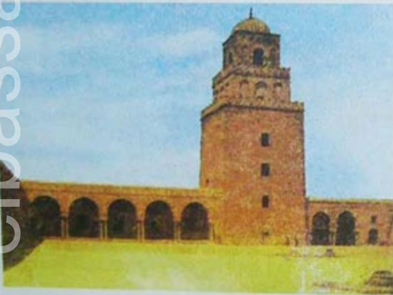
▲ مسجد القيروان بناه عقبة بن نافع